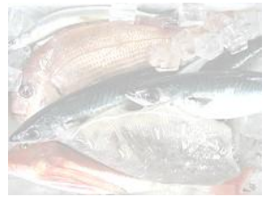
クラブのオフ会や納会に... 家族や仲間同士の親睦に...